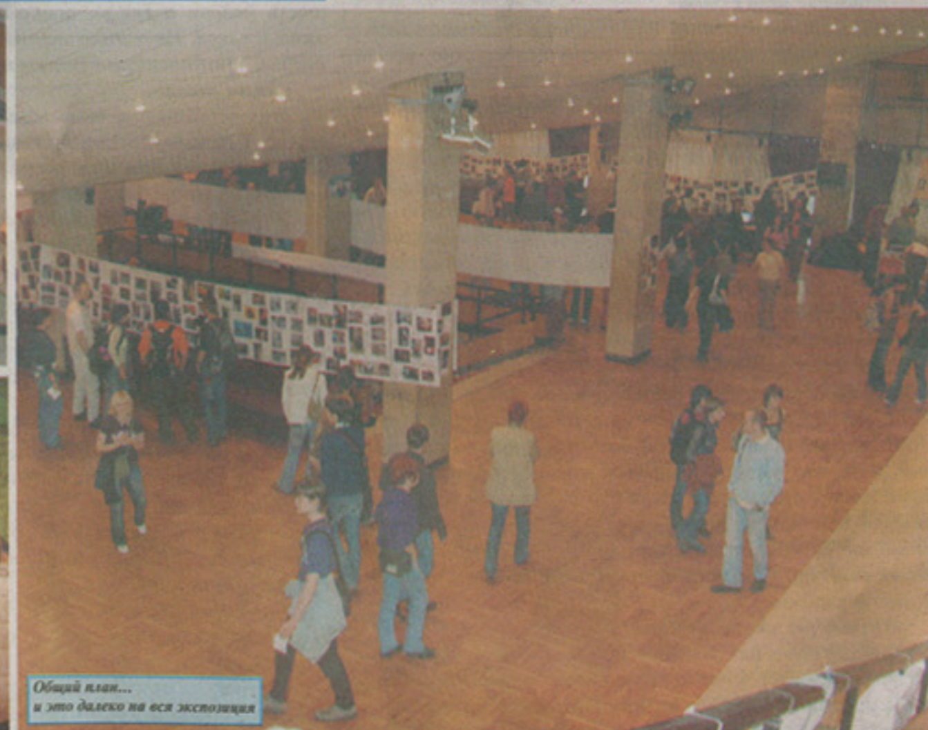
Общий план... и это далеко не вся экспозиция