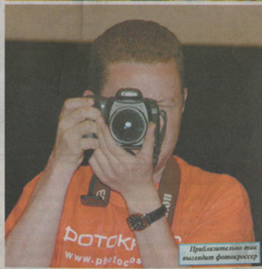
Приблизительно так выглядит фотокроссер