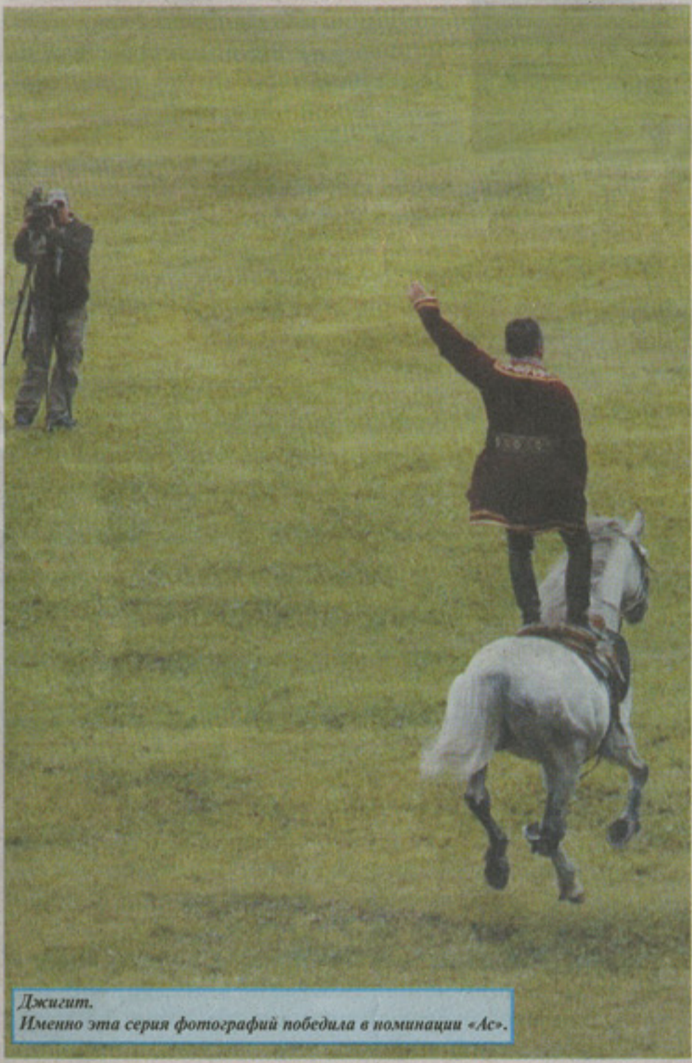
Джигит. Именно эта серия фотографий победила в номинации «Ас».