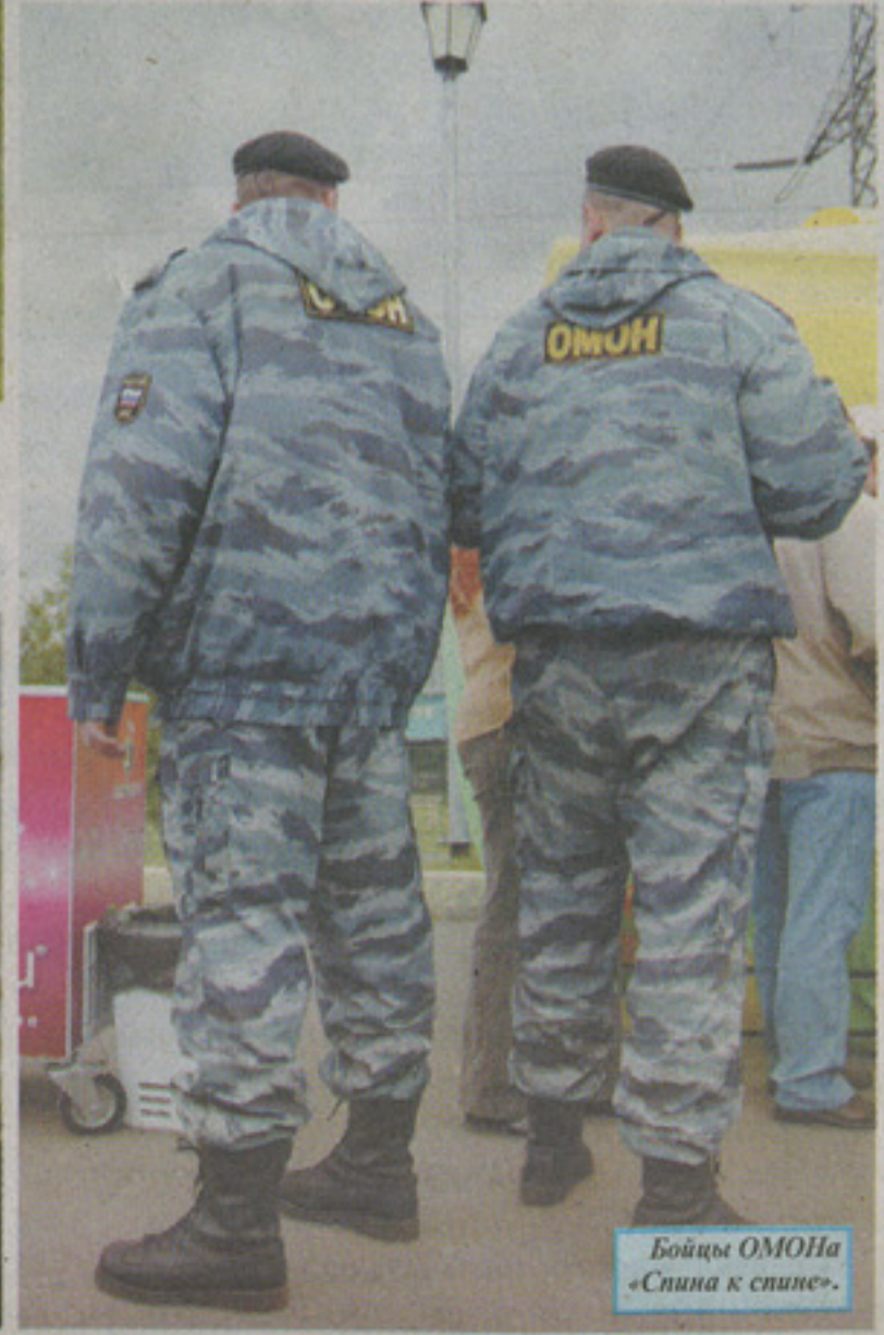
Бойцы ОМОНа «Спина к спине».