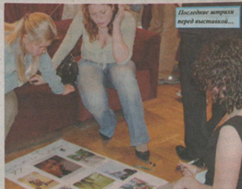
Последние штрихи перед выставкой...