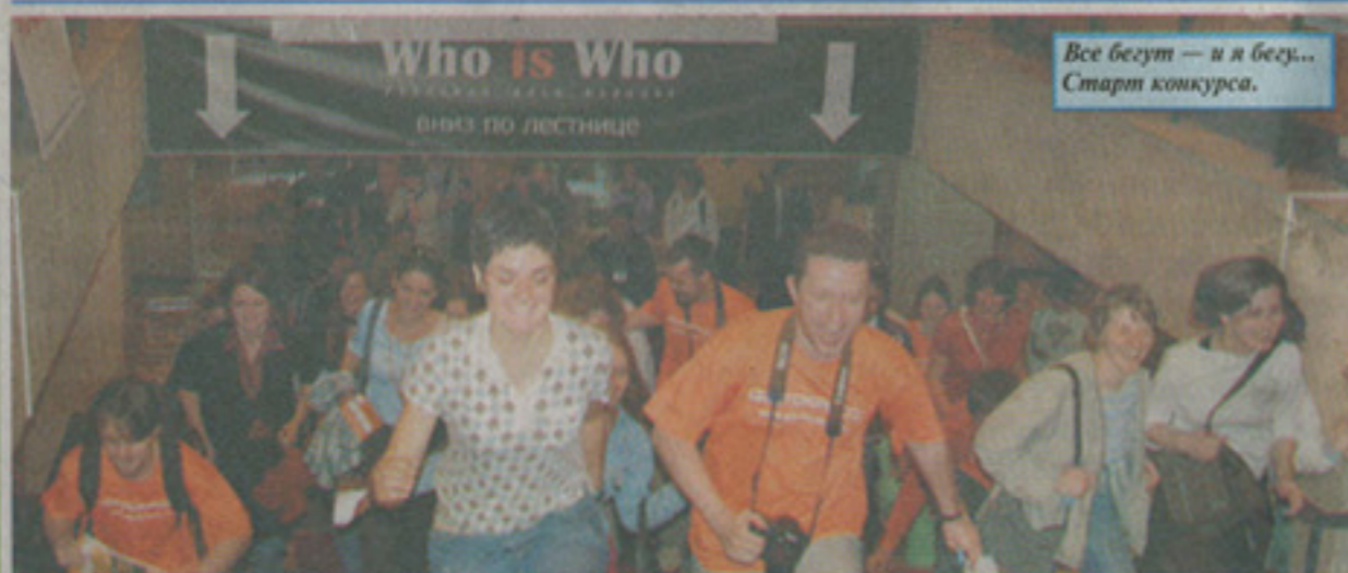
Все бегут — и я бесу... Старт конкурса.